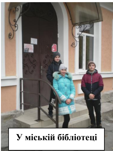
У міській бібліотеці