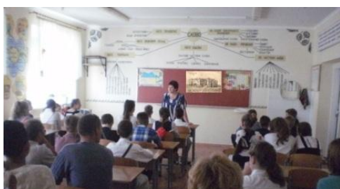
Година спілкування «Минуле живе, доки його пам'ятають» 3.10.2016

Дослідивши військову історію Миргородської школи № 1, ми дізналися про військово-медичне використання її приміщень у війнах ХХ ст., участь вихованців освітнього закладу у бойових діях, розвиток шпитально-медичної служби у Миргороді.