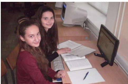
Шкільний кабінет інформатики. Робота в інтернеті