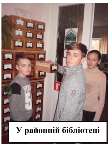
У районній бібліотеці

У ході радянсько-німецької війни школа знову знову отримала нове призначення: з 1941 по 1943 рр. у приміщенні було розміщено на проживання німецьких солдат, а у 1943–1944 рр. тут діяв радянський госпіталь. Роботу школи було відновлено вже 1943-го року, але у приміщенні колишнього воєнторгу (у сусідньому будинку лікаря і громадського діяча К.І.Горянова). [4]