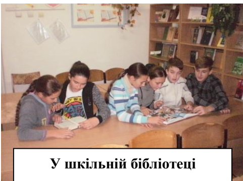
У шкільній бібліотеці

році, у розпал Першої світової війни приміщення гімназії було передано для шпиталю, але наступного 1916-го навчання було відновлено, у приміщення було переведено також жіночу гімназію. [1]