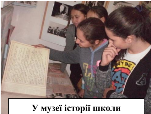
У музеї історії школи

Отже, обравши предмет дослідження, ми розпочали свою роботу із