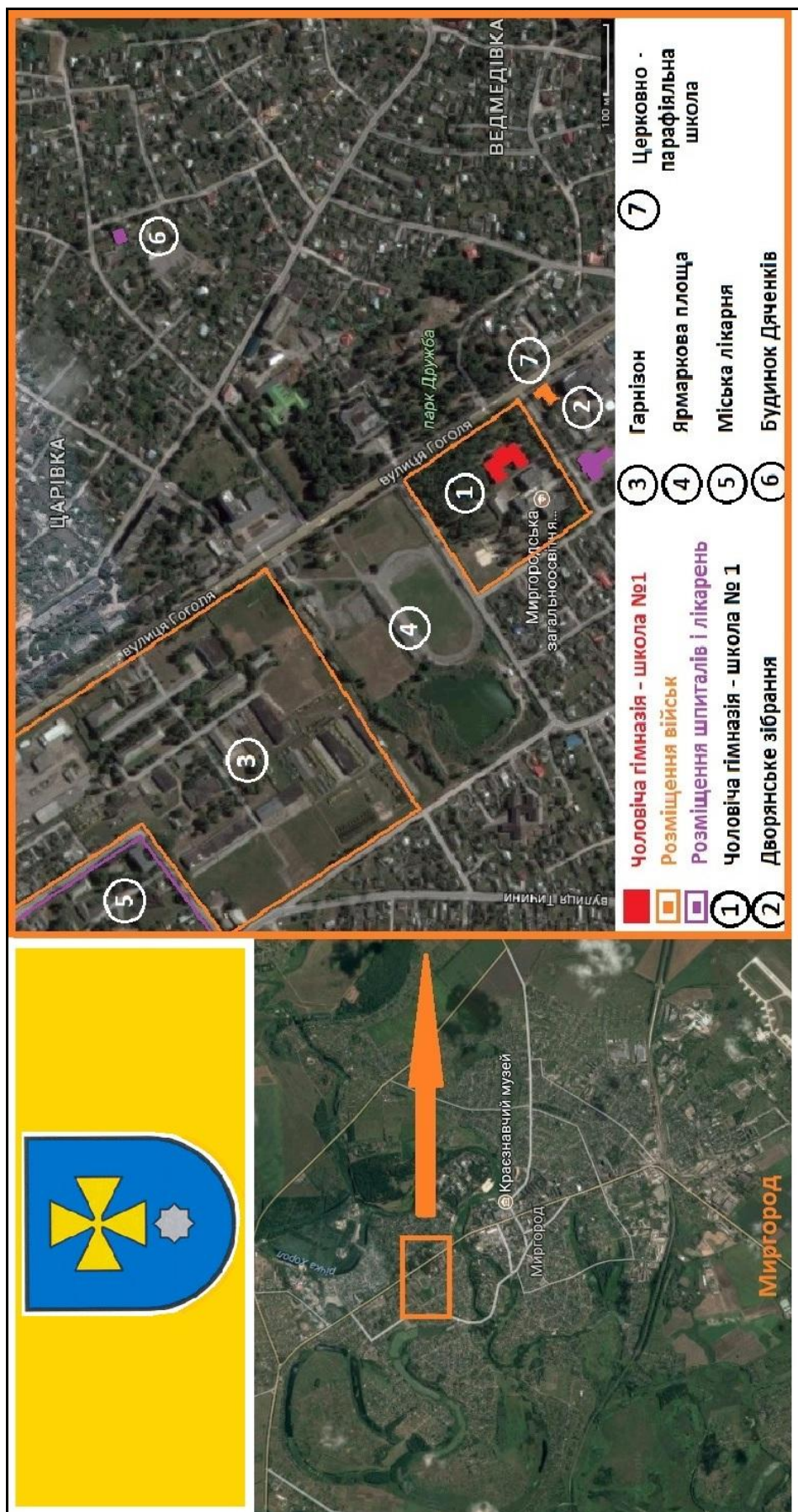
Додаток Б. Картосхема розміщення військових та медичних об'єктів у Миргороді на початку ХХ ст.